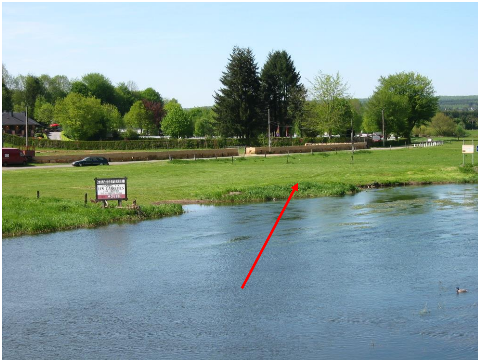
Point de débarquement de Chassepierre près du camping Les Cabrettes