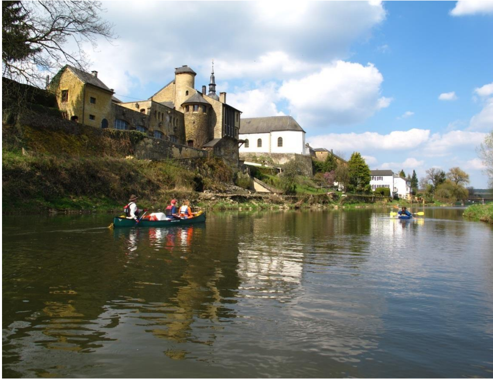
La Semois en arrivant à Chassepierre, une autre étape touristique importante sur ce parcours.