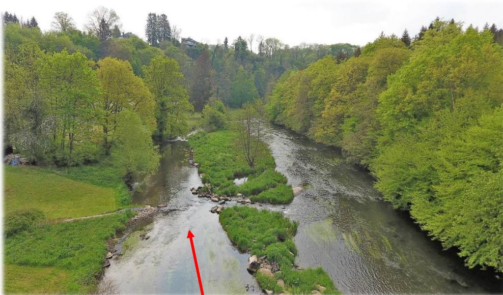
Le passage de la Noue. Cette passe est étroite, ne pas naviguer de front mais l'un derrière l'autre en laissant de la distance entre les kayaks. (attention branches basses, pierres et courant).