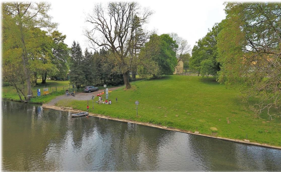
Arrivée au débarcadère de Lacuisine. Distance parcourue +/- 1/3 de la distance totale jusque Chassepierre