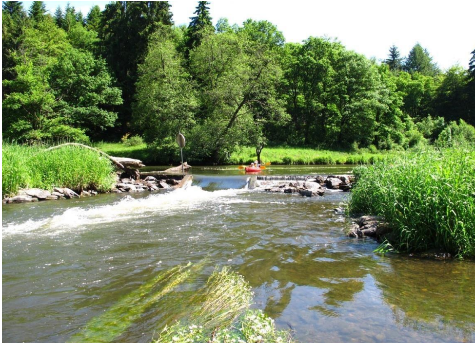
Passage du « Moulin Cambier ». Vue en aval.