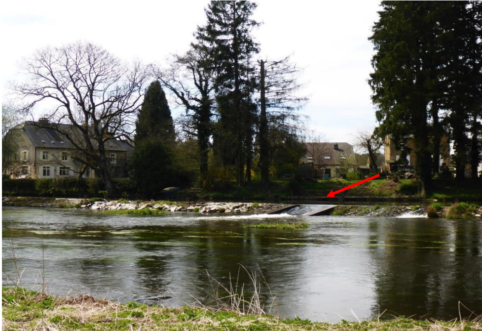
Le barrage de Lacuisine, à franchir par la belle passe aménagée au milieu (courant de rappel possible).