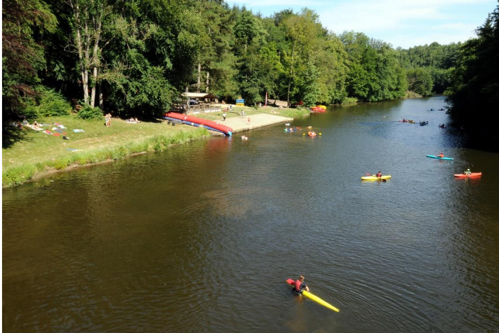
Point de départ des kayaks le Batifol, pont Saint Nicolas n°1, juste à l'entrée du camping le Canda. Zone de baignade.