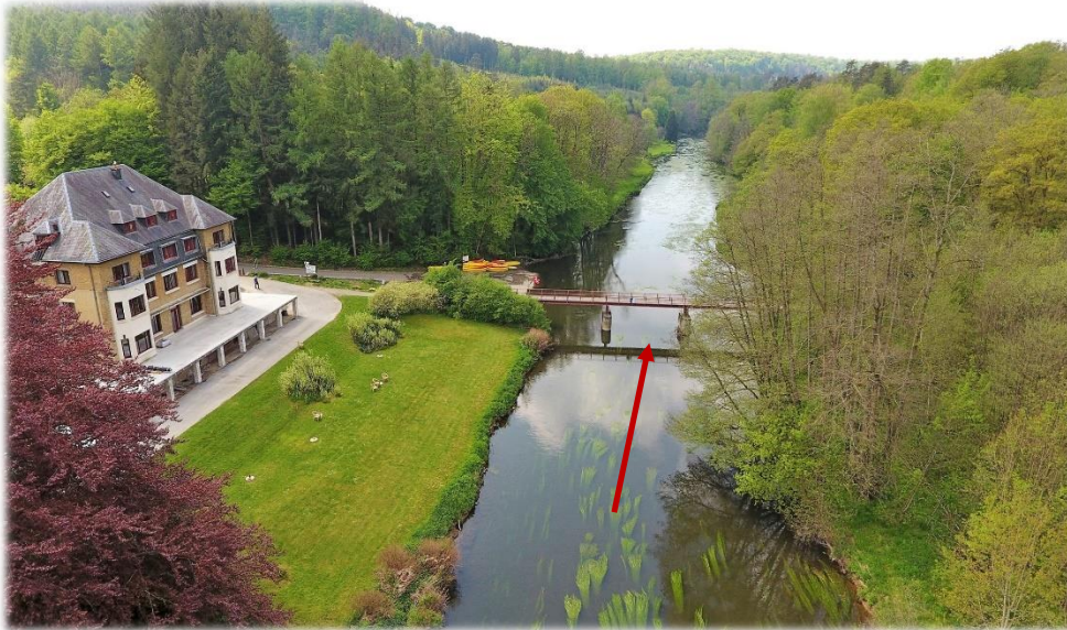
Passerelle de Chiny près de l'hôtel de comtes. Naviguer au centre de la rivière