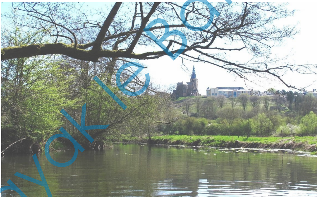
De Semois in Florenville.