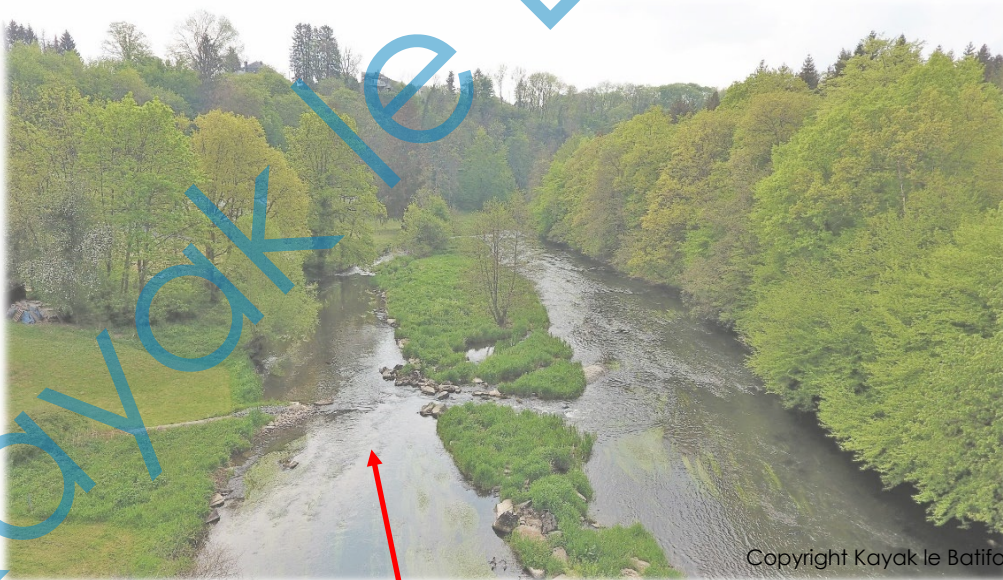
Doorgang bij de molen Cambier. Zicht stroomafwaarts.