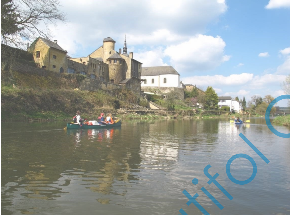
De Semois als je Chassepierre bereikt, een andere belangrijke toeristische halte op deze route.