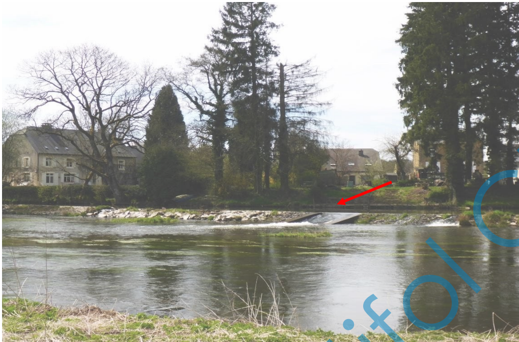
De stuw van Lacuisine, over te steken via de mooie centrale doorgang (let op mogelijke terugstroming).