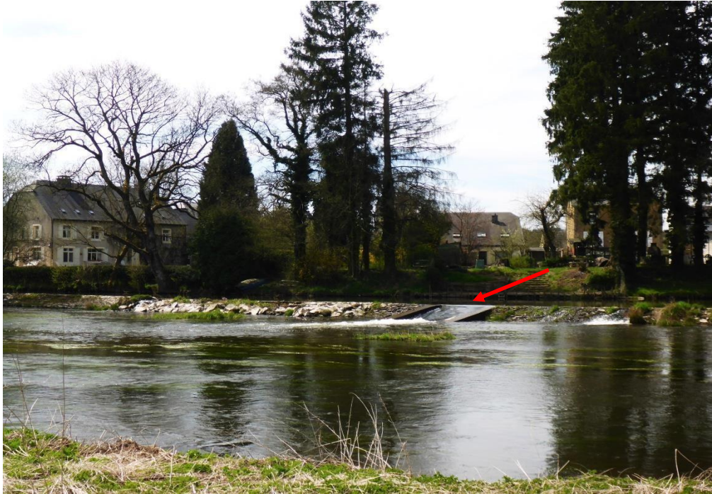
Le barrage de Lacuisine, à franchir par la belle passe aménagée au milieu (courant de rappel possible).