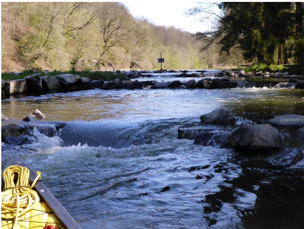
La succession de petits bassins du barrage des Nawés, vue de l'aval (bien rester au centre des passes).