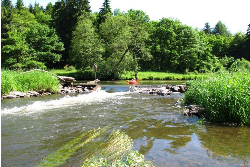
La passe du barrage de Chiny (Moulin Cambier), premier passage « mouillant » de ce parcours.