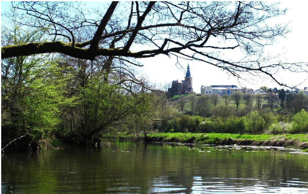
La Semois à Florenville, une étape touristique quasi obligée dans la région.