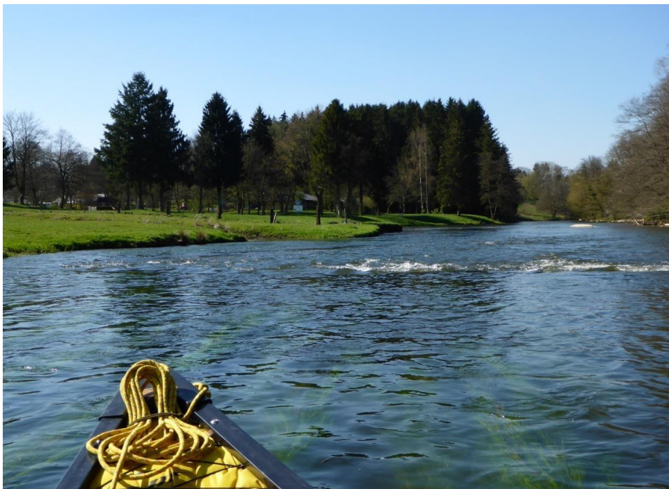
A l'approche de l'aire « Conroy » à Sainte-Cécile.