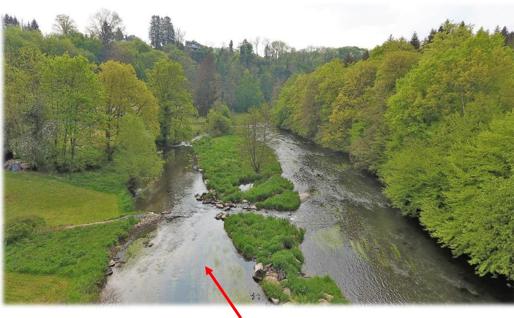
Le passage de la Noue. Cette passe est étroite, ne pas naviguer de front mais l'un derrière l'autre en laissant de la distance entre les kayaks. (attention branches basses, pierres et courant).