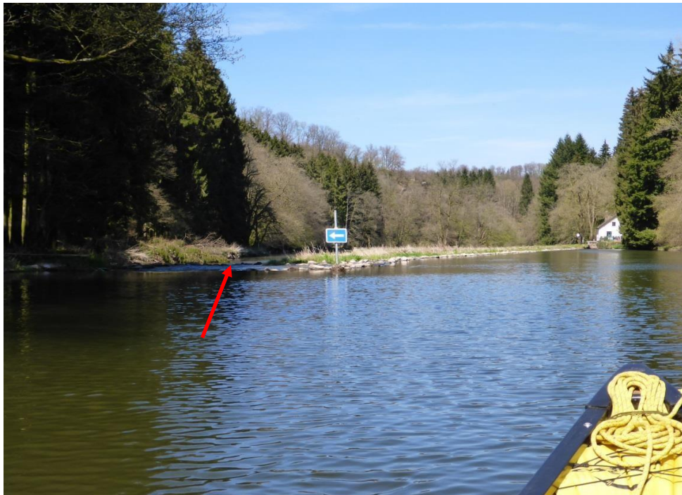
Le barrage des Nawés (Moulin Deleau) : un passage faussement débonnaire où le risque d'abimer son embarcation est très réel. Le franchissement n'est pas aménagé pour les canoës-kayaks (ferrailles).